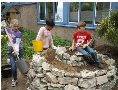
Bau einer Kräuterspirale