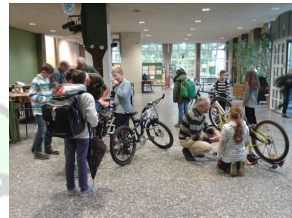
Fahrradworkshop Oktober 2015